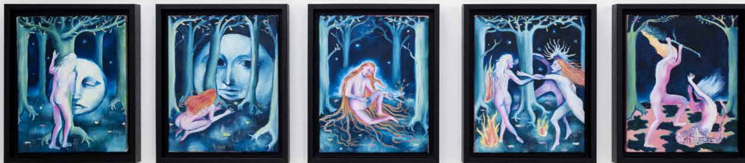
"BAD MOON RISING SERIES" 5x