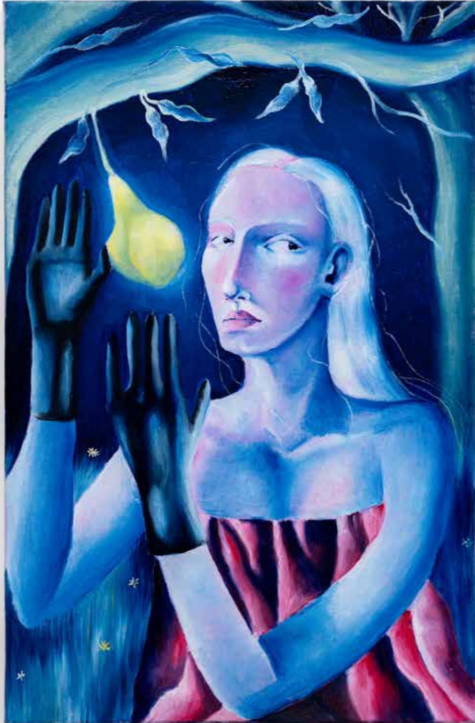
“LA RAGAZZA DALLE MANI D’ARGENTO”