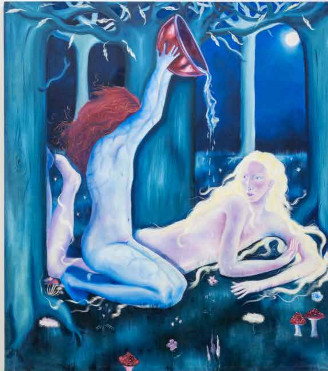
"SOTTO IL NOCE DI BENEVENTO"

170x150 cm. Oil and wax pastels on canvas